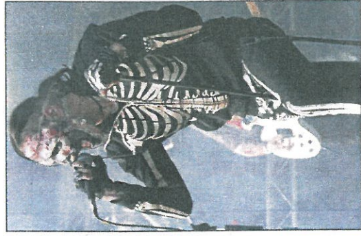
Gruselig: „Jamey Rottencorpse and The Rising Dead“.