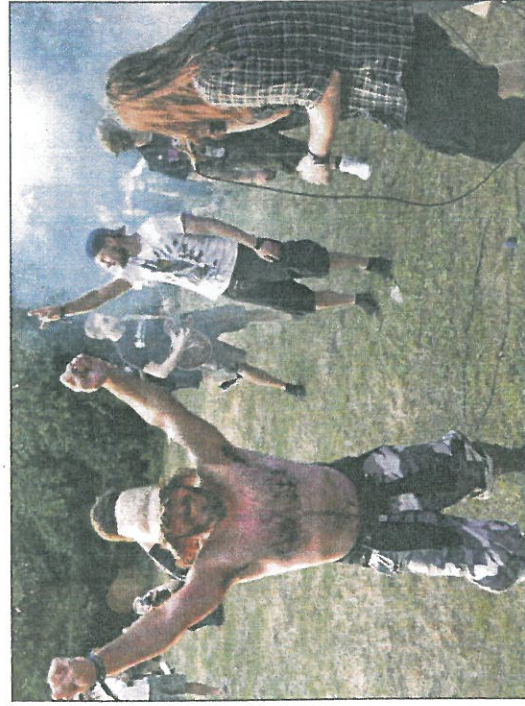
„Oben ohne“ auf der Pferdewiese: Geliebte Freikörperkultur zeigte ein „Goats Rising“-Fan am Samstagabend im sonnigen Seedorf.