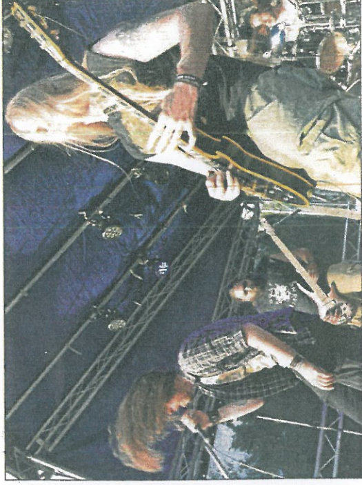
Wehende Haare: Die Band „Goats Rising“ aus Braunschweig gab einen Vorgeschmack auf ihre CD-Veröffentlichung im Oktober.